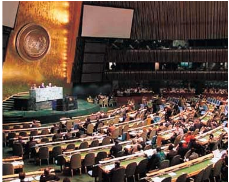
国連ミレニアム・サミット

この地球で安定的にどのくらいの間が生きていけるのでしょうか。もちろん消費水準によって大きく変わりますので、一言ではいえません。