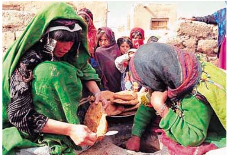
アフガニスタン難民の女性

必然的に女性の健康状態の改善や、家族計画を必要とする人たちが入手できる「選択権」の拡大が必要となりますが——を改善することで、自然に人口増加率を低下させようという指針が決定されました。