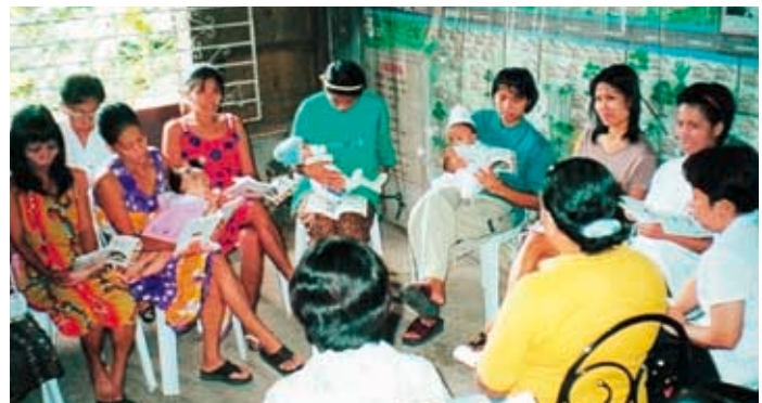
週に1度、10回シリーズで開催される母親学級。 栄養について、ボランティアをリーダーとして学びます。