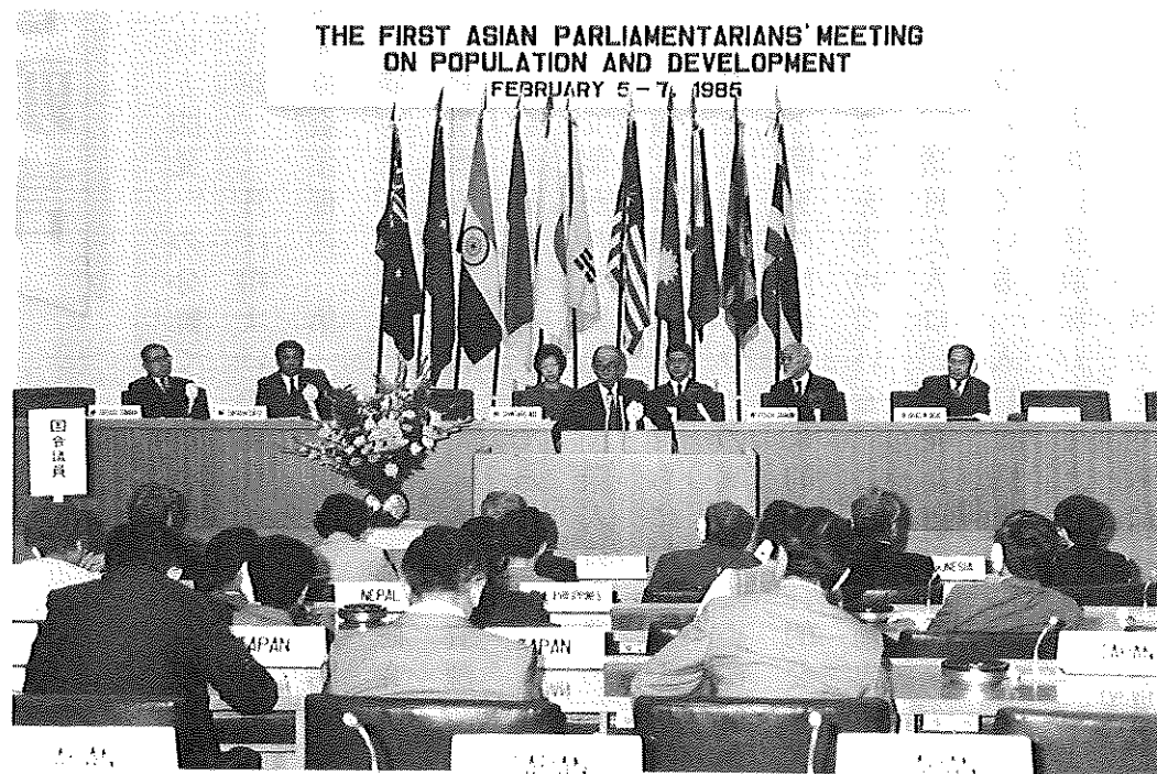
「第1回人口と開発・アジア国会議員代表者会議」開会式（外務省国際会議場で）