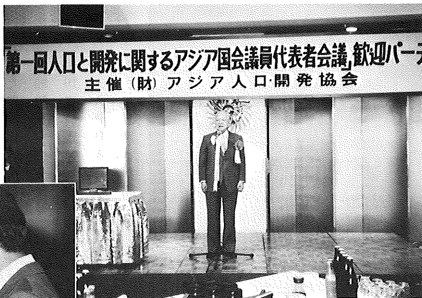
謝辞を述べる 笹川良一・(財)日本船舶振興会々長 (マツヤ・サロンで)

られた。 笹川会長は、「人類平和のための尊い事業を行なっておられる方に、私たちが人手がなくてできないことをやっていたのであって、こちらから感謝を申しあげ