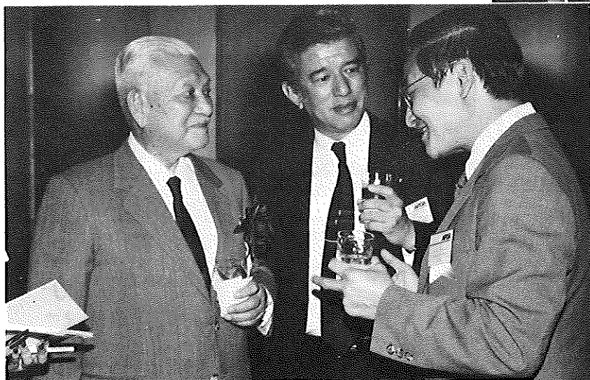
笹川良一・日本船舶振興会々長と懇談する中山・自民党国民運動本部長(中央)とブンティウム・タイ運輸通信副大臣 =マツヤ・サロンで

このレセプションには佐藤守良・農林水産大臣や、中山・自民党国民運動本部長など国会議員、人口問題関係者も多数出席、